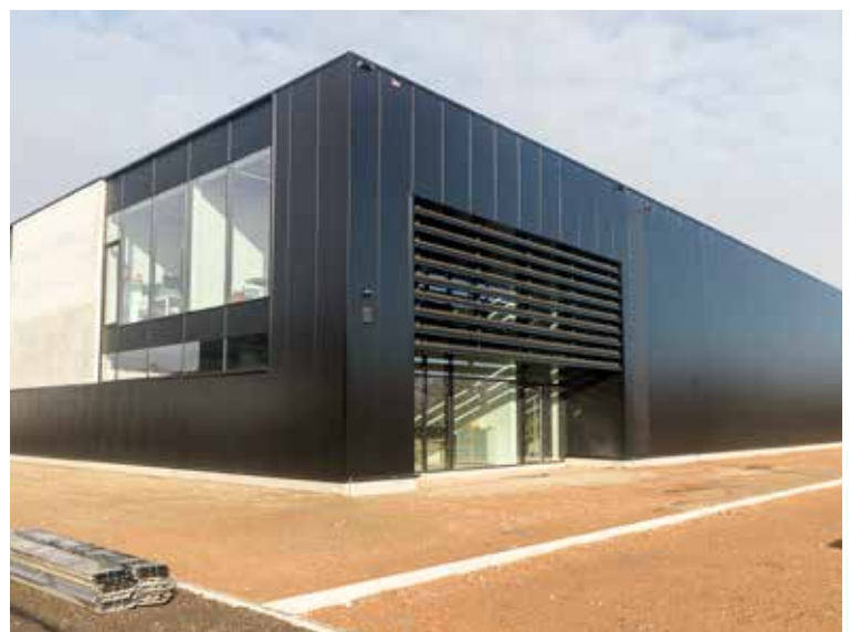
Het nieuwe pand.