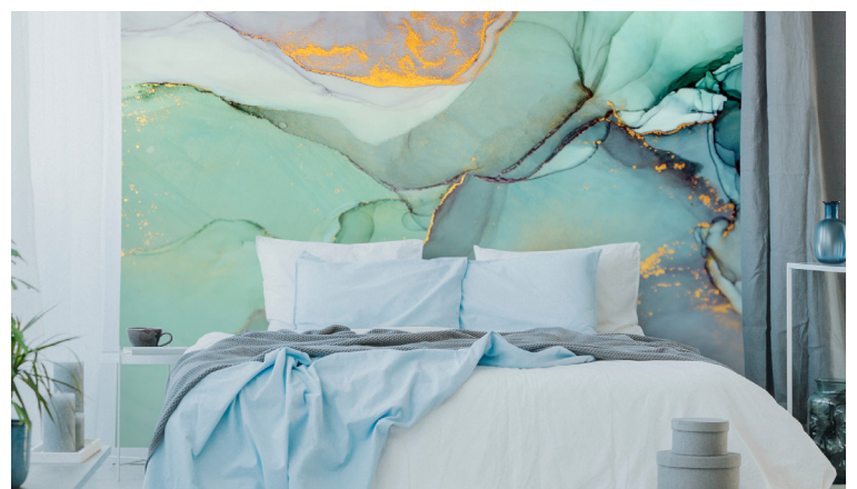
Op deze pagina's enkele voorbeelden van behang uit de MacTac collectie.